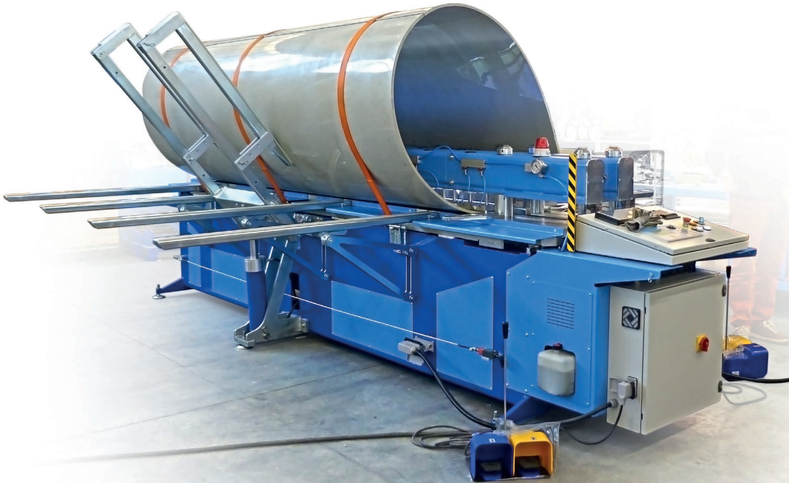
Saldalastre - Sheets Welding Machines SLG 3000